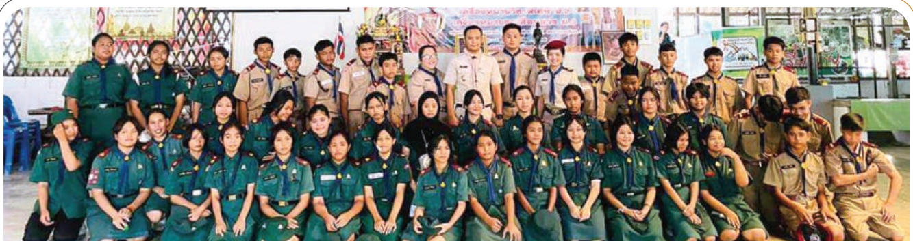
TARAENG SUBDISTRICT ADMINISTRATIVE ORGANIZATION