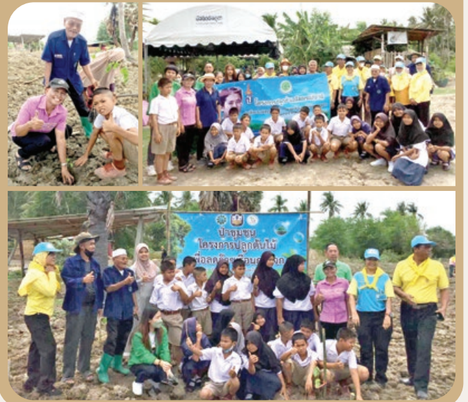
“ปลูกต้นไม้ร่วมกับธนาคาร ธ.ก.ส.”

TARAENG SUBDISTRICT ADMINISTRATIVE ORGANIZATION