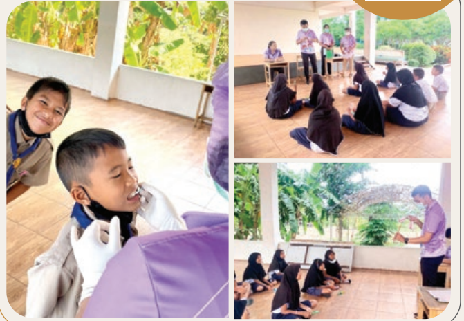
“กิจกรรมตรวจสอบคุณภาพนักเรียน”

TARAENG SUBDISTRICT ADMINISTRATIVE ORGANIZATION