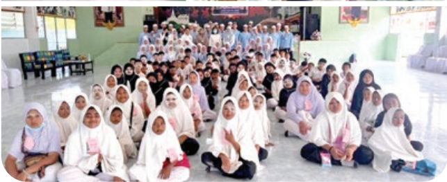
“กิจกรรมเข้าค่ายคุณธรรม 2 ศาสนา”