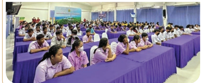
“ กิจกรรมแนะแนวอาชีพและการศึกษาต่อ ”