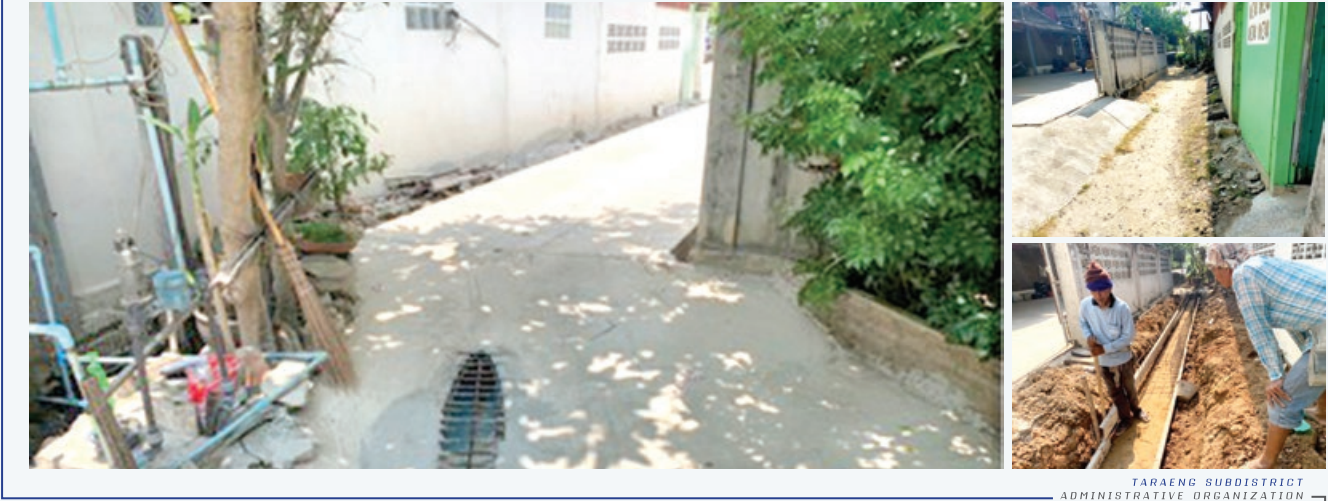
TARAENG SUBDISTRICT ADMINISTRATIVE ORGANIZATION