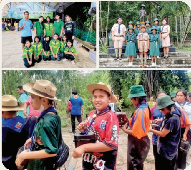
“เข้าค่ายลูกเสือ-เนตรนารี-สามัญ ณ ค่ายครูเชียร”

TARAENG SUBDISTRICT ADMINISTRATIVE ORGANIZATION