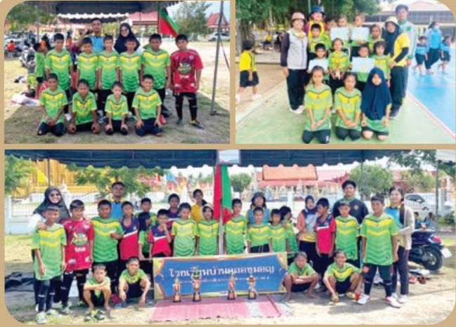
“การแข่งขันกีฬากลุ่มเครือข่ายที่ 10”

TARAENG SUBDISTRICT ADMINISTRATIVE ORGANIZATION