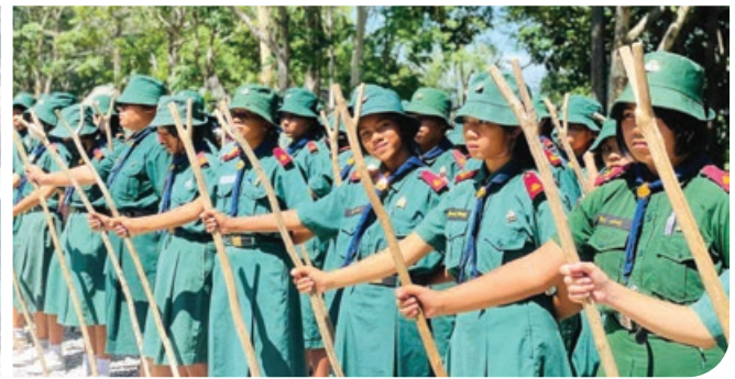
“ กิจกรรมเข้าค่ายพักแรมลูกเสือ-เนตรนารีสามัญรุ่นใหญ่ ชั้น ม.1-ม.3 ณ ค่ายครูเชิษ ”