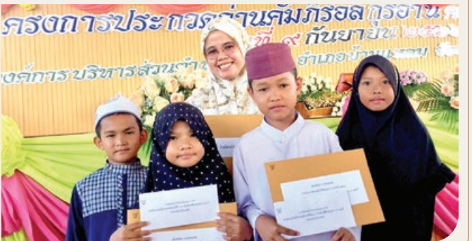
“แข่งขันการอ่านพระมหาคัมภีร์อัลกุรอ่าน”