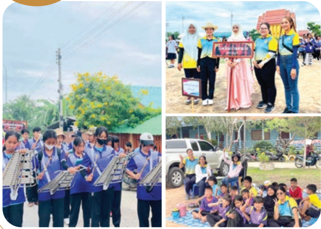
TARAENG SUBDISTRICT ADMINISTRATIVE ORGANIZATION