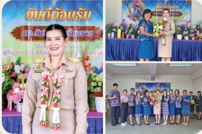
TARAENG SUBDISTRICT ADMINISTRATIVE ORGANIZATION

“ต้อนรับท่านผู้อำนวยการวันวิสาขะ พริมพราย ในโอกาสมาดำรงตำแหน่งผู้อำนวยการโรงเรียนวัดกุฎี (นันทวิเทศประชาสรรค์)”