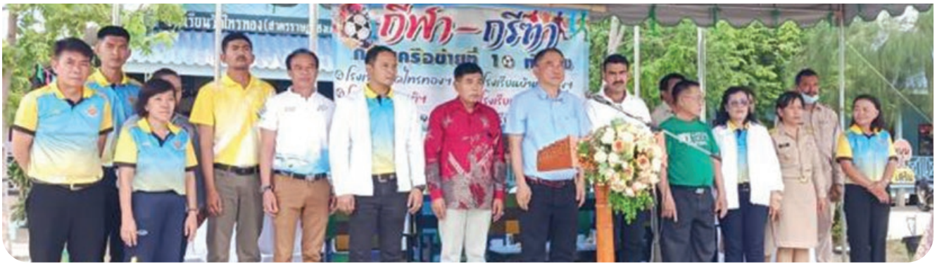
“กีฬากลุ่มเครื่อง่ายที่ 10”