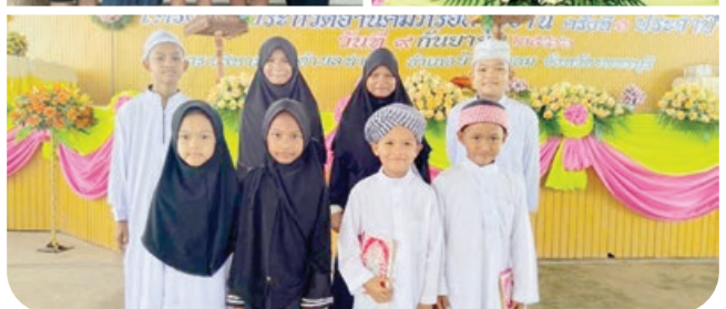
“กิจกรรมประกวดสวดสรภัญญะ อ่านคำภีร์อัลกุรอาน”