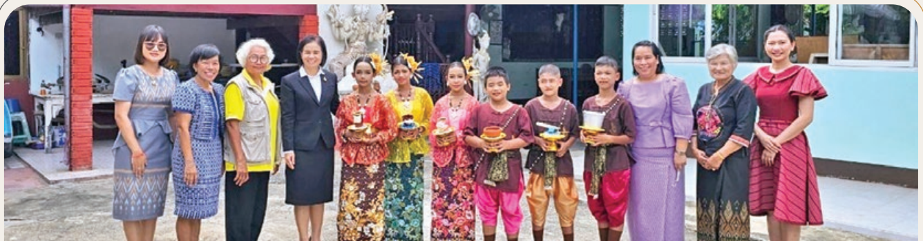
TARAENG SUBDISTRICT ADMINISTRATIVE ORGANIZATION

“กิจกรรมการอยู่ค่ายพักแรมลูกเสือ-เนตรนารีสามัญ อ.บ้านแหลม ณ ค่ายลูกเสือครูเชียร อ.บ้านลาด จ.เพชรบุรี”