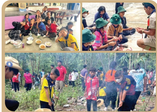
“ กิจกรรมเข้าค่ายพักแรมลูกเสือ-เนตรนารีสามัญ ชั้น ป.6 ”