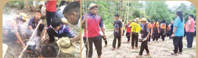
“กิจกรรมเข้าค่ายลูกเสือสามัญ ชั้น ป.6 ณ ค่ายครูเชียร”